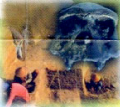
Sangiran, Situs Manusia Purba