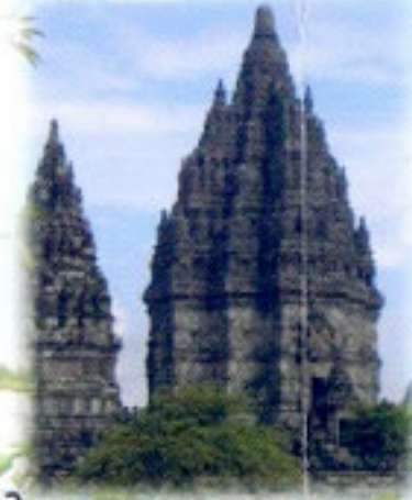
Kompleks Candi Prambanan