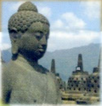
Kompleks Candi Borobudur