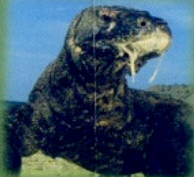
Taman Nasional Komodo