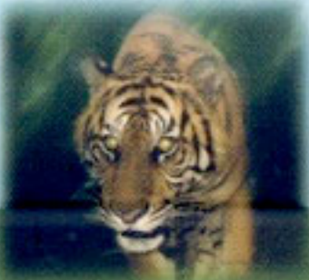
Warisan Hutan Hujan Tropis Sumatera