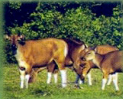
Taman Nasional Ujung Kulon