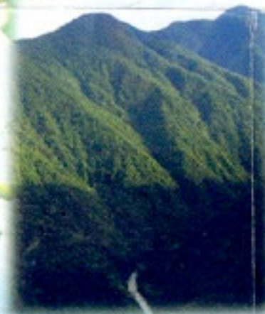
Taman Nasional Lorentz